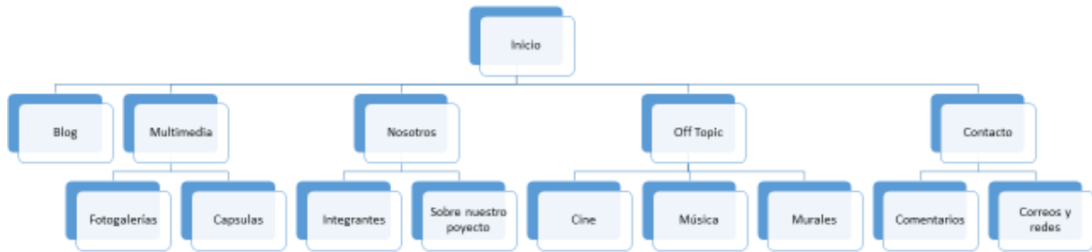
Diagrama de secciones

A través del apartado de Contacto la gente podrá depositar comentarios al respecto de las notas del blog, así como también encontrará nuestras redes sociales donde podrá estar en interactividad con nosotros.